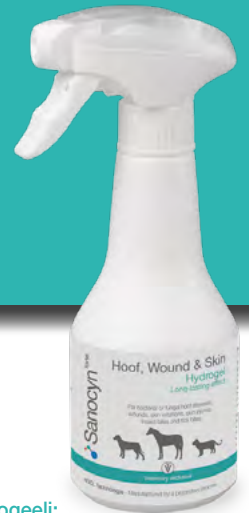
Hydrogeeli: Kaviot, haavat ja iho

Ingredients: Aqua, Sodium Chloride, LiMgNa-Silicate, Active Chlorine Released from Hypochlorous Acid 300-650 ppm