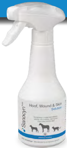
Huuhde: Kaviot, haavat ja iho